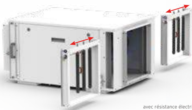
avec résistance électrique

Directement installées dans la centrale de déshumidification, elles ne rajoutent aucun encombrement et se mettent en place facilement en les glissant dans les emplacements prévus.