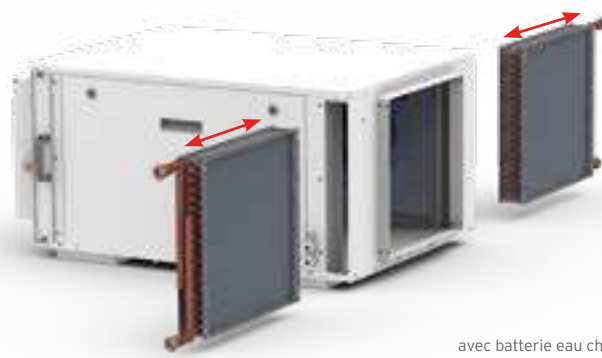
avec batterie eau chaude