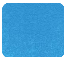
Bleu Azur 237460/AB