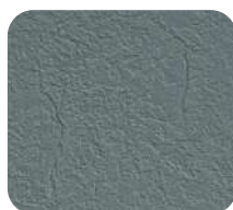
Gris Moyen 237460/GM