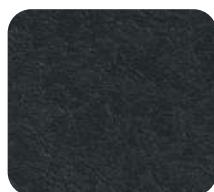
Gris Basalte 237460/GA