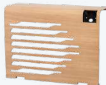
EN OPTION : WOOD Bois FSC issus de forêts gérées de façon durable. Brut - à lasurer.