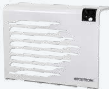
EN OPTION : CRISTAL Métal blanc brillant en option