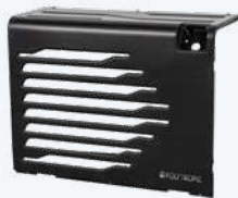
DE SERIE : DARK ABS 70% recyclé noir mat

Équipée de série avec la façade DARK ABS, la façade choisie en option est livrée montée :