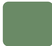
Vert Naturel 156966/VG