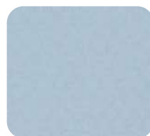
Gris Clair 156966/GC