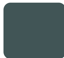
Gris Basalte 156966/GA