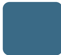
Bleu Saphir 156966/BS