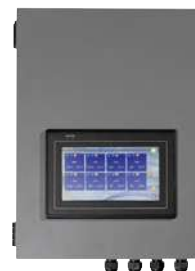
Ecran de contrôle unique déporté dans le local technique pour pilotage de plusieurs unités (en option) Code : AO1500001