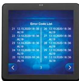
Historique des 50 derniers événements