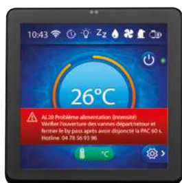
Affichage de l'alarme, diagnostic et solution de résolution