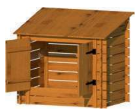
Ouverture 2 portes sur le dessus & 2 portes en façade

Attention : Les locaux technique évoluent courant 2025 !