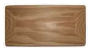
Pièces de jonctions Premium

Local technique bois traité classe 4. Assemblage mi-bois dans les angles. Épaisseur structure 2,2 cm. Livré avec loquet de fermeture et notice.