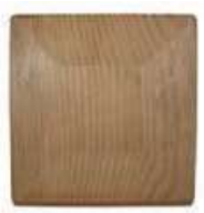
Pièces de jonctions Premium

Pièces de jonction : carrée ou rectangulaire (selon forme et dimensions).