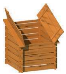
Ouverture 2 portes sur le dessus

Local technique bois traité classe 4. Assemblage mi-bois dans les angles. Épaisseur structure 2,2 cm. Livré avec loquet de fermeture et notice.