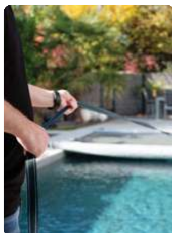
Sangle de déroulement