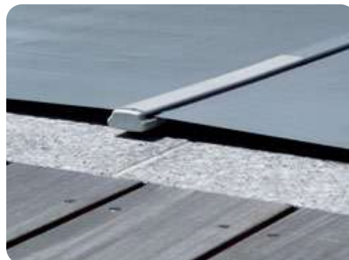
Barre de maintien en aluminium anodisé à embouts aplatis