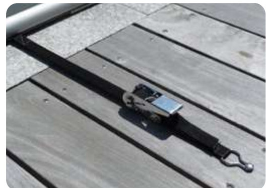
Cliquet de tension