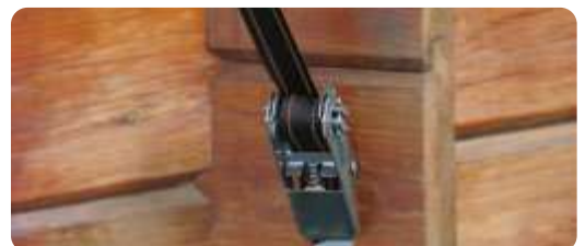
Cliquet de tension inox