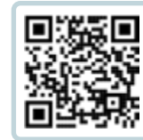
Vidéo de manipulation

Déroulement par sangle : Tirage, mise en position sécurité et fixation en moins de 3 minutes