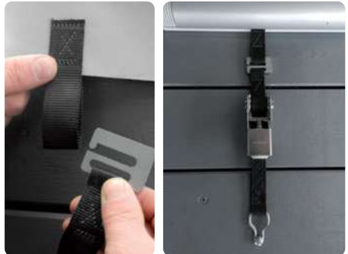
Système d'attache rapide (option)