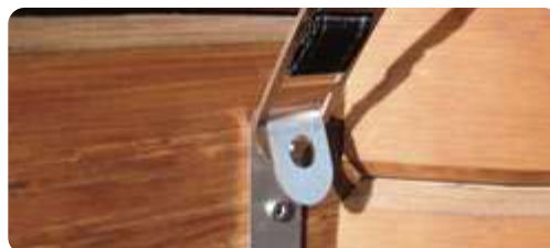
Crochet de fixation inox