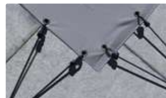
SAND : Cabiclics doubles embouts