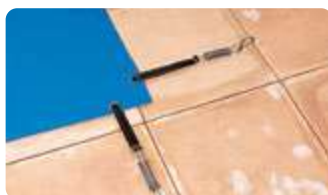
STAR : Sangles + ressorts