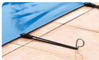
FIX : Pinces fix kit