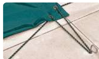
HIVERSAND : Sandow périphérique (non conforme à la norme NF P 90-308)