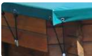
WOOD : Cabiclics doubles embouts (pour piscines hors sol bois)